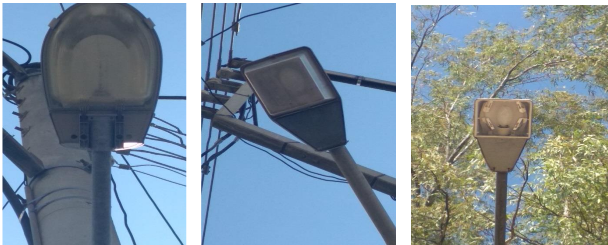
Εικόνες υφιστάμενων τοποθετημένων φωτιστικών σε οδούς, πριν την παρέμβαση.

Τα προσφερόμενα φωτιστικά της κατηγορίας, πρέπει να συμμορφώνονται με τις παρακάτω απαιτήσεις: