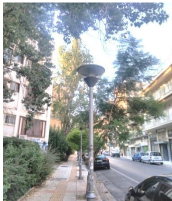
Εικόνες υφιστάμενων τοποθετημένων φωτιστικών (Τύπου Οδού Γ. Θεολόγου), πριν την παρέμβαση

Οι απαιτήσεις συμμόρφωσης (τεχνικά χαρακτηριστικά και πιστοποιήσεις) ταυτίζονται με αυτές των Φωτιστικών Σωμάτων ΚΟΡΥΦΗΣ (για πάρκα και πλατείας) ή Φωτιστικών Σωμάτων ΒΡΑΧΙΟΝΑ – ΟΔΩΝ της παραγράφου 2Ε και 2Β αντίστοιχα, ανάλογα με το φωτοτεχνικό μοντέλο που επιλέγει ο ανάδοχος .