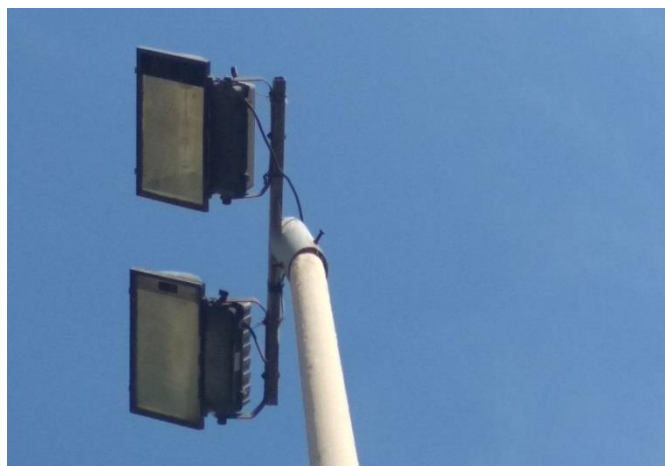
Εικόνες υφιστάμενων τοποθετημένων φωτιστικών σε αθλητικούς χώρους, πριν την παρέμβαση.

Τα προσφερόμενα φωτιστικά της κατηγορίας, πρέπει να συμμορφώνονται με τις παρακάτω απαιτήσεις