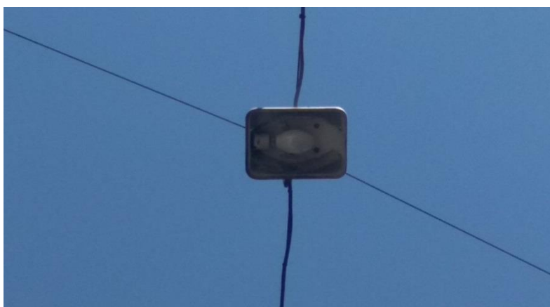
Εικόνες υφιστάμενων τοποθετημένων αξονικών φωτιστικών σε οδούς, πριν την παρέμβαση

Τα προσφερόμενα φωτιστικά της κατηγορίας, πρέπει να συμμορφώνονται με τις παρακάτω απαιτήσεις: