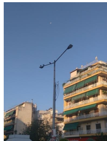
Εικόνες υφιστάμενων τοποθετημένων φωτιστικών σε λεωφόρους, πριν την παρέμβαση

Τα προσφερόμενα φωτιστικά της κατηγορίας, πρέπει να συμμορφώνονται με τις παρακάτω απαιτήσεις: