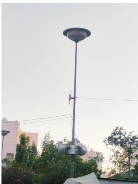
Εικόνα υφιστάμενου φωτιστικού κορυφής στην κεντρική πλατεία, πριν την παρέμβαση

Τα προσφερόμενα φωτιστικά τεχνολογίας LED πρέπει να συμμορφώνονται με τις παρακάτω απαιτήσεις: